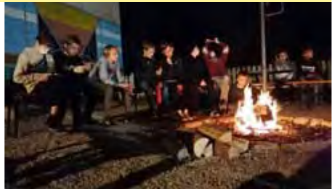
Lagerfeuer auf der Präpifreizeit, Foto: W. Glitt

So ist dies nun vorerst der letzte Gemeindebrief, an dem wir uns beteiligen. Die Zukunft wird zeigen, wie wir uns aufstellen werden. Natürlich sind wir als Kirchengemeinde, Pres-