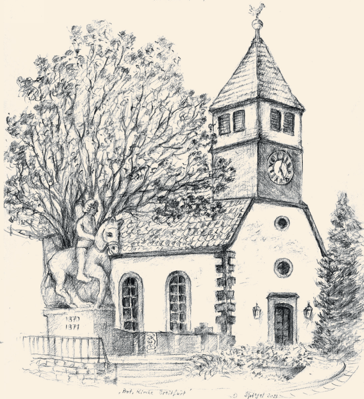
Prot. Kirche / Breitfurt