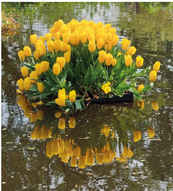
Schwimmende Tulpen im Vondelpark in Amsterdam